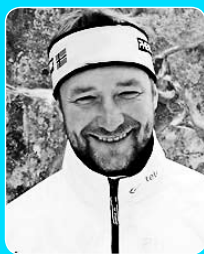
Kjetil André Aamodt